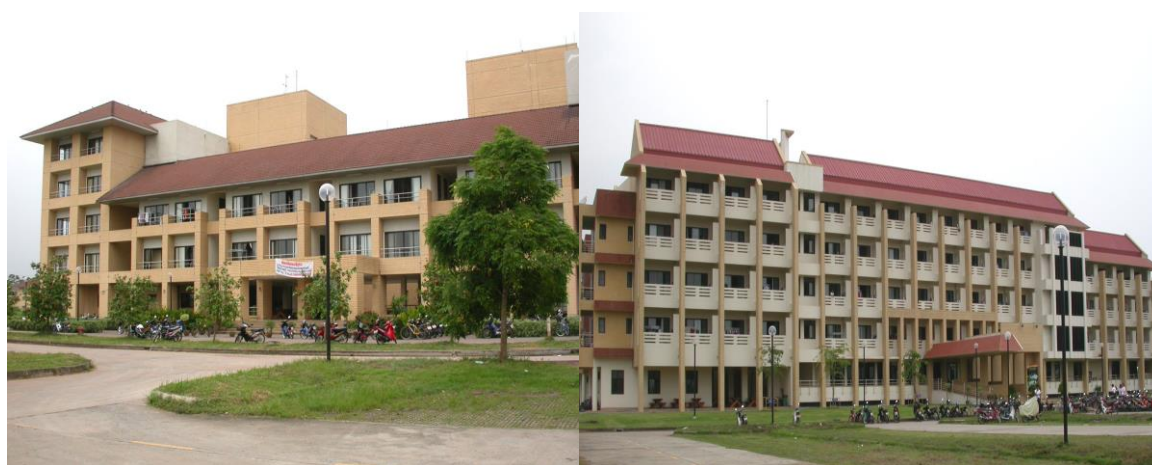
หอพักนักศึกษาหญิง