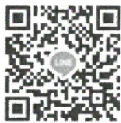
กลุ่มไลน์ (Line) “BAS(68)-Portfolio 1.1”

5. วันที่ 1 ธันวาคม พ.ศ. 2567 ทางคณะฯ จะดำเนินการสอบสัมภาษณ์ผ่านทางโปรแกรมประชุม ออนไลน์ Google Meet โดยผู้สมัคร ไม่ต้อง เดินทางมาสอบที่คณะฯ โดยให้ผู้ที่มีรายชื่อมีสิทธิสอบประเมิน ความสามารถด้วยการสอบสัมภาษณ์เข้ากลุ่มไลน์ (Line) “BAS(68)-Portfolio 1.1” เพื่อเป็นช่องทางในการนัดหมาย การสอบสัมภาษณ์ ที่ลิงก์ https://line.me/R/ti/g/hnhkSEEsrq หรือ สแกน QR code