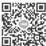
กลุ่มไลน์ (Line) “BAS(68)-Portfolio 1.1”

5. วันที่ 1 ธันวาคม พ.ศ. 2567 ทางคณะฯ จะดำเนินการสอบสัมภาษณ์ผ่านทางโปรแกรมประชุม ออนไลน์ Google Meet โดยผู้สมัคร ไม่ต้อง เดินทางมาสอบที่คณะฯ โดยให้ผู้ที่มีรายชื่อมีสิทธิ์สอบประเมิน ความสามารถด้วยการสอบสัมภาษณ์เข้ากลุ่มไลน์ (Line) “BAS(68)-Portfolio 1.1” เพื่อเป็นช่องทางในการนัดหมาย การสอบสัมภาษณ์ ที่ลิงก์ https://line.me/R/ti/g/hnhkSEEsrq หรือ สแกน QR code