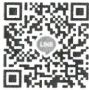
กลุ่มไลน์ (Line) “BAS(68)-Portfolio 1.1”

5. วันที่ 1 ธันวาคม พ.ศ. 2567 ทางคณะฯ จะดำเนินการสอบสัมภาษณ์ผ่านทางโปรแกรมประชุมออนไลน์ Google Meet โดยผู้สมัคร ไม่ต้อง เดินทางมาสอบที่คณะฯ โดยให้ผู้ที่มีรายชื่อมีสิทธิสอบประเมินความสามารถด้วยการสอบสัมภาษณ์เข้ากลุ่มไลน์ (Line) “BAS(68)-Portfolio 1.1” เพื่อเป็นช่องทางในการนัดหมายการสอบสัมภาษณ์ ที่ลิงก์ https://line.me/R/ti/g/hnhkSEEsrg หรือ สแกน QR code