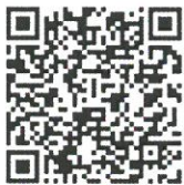
คู่มือการใช้ระบบการชำระเงินนักศึกษาใหม่

4. วันที่ 11 - 17 กุมภาพันธ์ พ.ศ. 2568 : ผู้ผ่านคัดเลือกต้องยืนยันสิทธิ์การเป็นนักศึกษาของคณะฯ ด้วยการเข้าระบบพิมพ์ใบแจ้งชำระค่าธรรมเนียมและค่าบำรุงการศึกษาตามระเบียบมหาวิทยาลัยที่ ระบบการชำระเงินนักศึกษาใหม่ ทางเว็บไซต์ https://reg.kmutnb.ac.th/registrar/home และนำเอกสารไปจ่ายชำระเงินที่ธนาคาร จำนวน 21,550.00 บาท (สองหมื่นหนึ่งพันห้าร้อยห้าสิบบาทถ้วน) ทั้งนี้การยืนยันจะสมบูรณ์เมื่อมีการชำระเงินเรียบร้อยแล้ว สามารถศึกษาคู่มือการใช้ระบบการชำระเงินนักศึกษาใหม่ โดยสแกน QR code