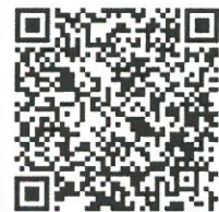
วิธีเข้าระบบชำระเงิน