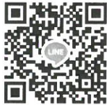
กลุ่มไลน์ (Line) “BAS(69)-Quota”

5. วันที่ 20 เมษายน พ.ศ. 2569 ทางคณะฯ จะดำเนินการสอบสัมภาษณ์ผ่านทางโปรแกรมประชุมออนไลน์ Google Meet โดยผู้สมัครไม่ต้องเดินทางมาสอบที่คณะฯ โดยให้ผู้ที่มีรายชื่อมีสิทธิ์สอบประเมินความสามารถด้วยการสอบสัมภาษณ์เข้ากลุ่มไลน์ (Line) “BAS(69)-Quota” เพื่อเป็นช่องทางในการนัดหมายการสอบสัมภาษณ์ ที่ลิงก์ https://line.me/R/ti/g/PvR-JeVJ5G หรือ สแกน QR code