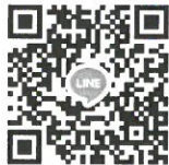
กลุ่มไลน์ (Line) “BAS(69)-Quota”

5. วันที่ 20 เมษายน พ.ศ. 2569 ทางคณะฯ จะดำเนินการสอบสัมภาษณ์ผ่านทางโปรแกรมประชุมออนไลน์ Google Meet โดยผู้สมัครไม่ต้องเดินทางมาสอบที่คณะฯ โดยให้ผู้ที่มีรายชื่อมีสิทธิสอบประเมิน ความสามารถด้วยการสอบสัมภาษณ์เข้ากลุ่มไลน์ (Line) “BAS(69)-Quota” เพื่อเป็นช่องทางในการนัดหมายการ สอบสัมภาษณ์ ที่ลิงก์ https://line.me/R/ti/g/PvR-JeVJ5G หรือ สแกน QR code