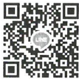
กลุ่มไลน์ (Line) “BAS(69)-Quota”

5. วันที่ 20 เมษายน พ.ศ. 2569 ทางคณะฯ จะดำเนินการสอบสัมภาษณ์ผ่านทางโปรแกรมประชุมออนไลน์ Google Meet โดยผู้สมัครไม่ต้องเดินทางมาสอบที่คณะฯ โดยให้ผู้ที่มีรายชื่อมีสิทธิ์สอบประเมินความสามารถด้วยการสอบสัมภาษณ์เข้ากลุ่มไลน์ (Line) “BAS(69)-Quota” เพื่อเป็นช่องทางในการนัดหมายการสอบสัมภาษณ์ ที่ลิงก์ https://line.me/R/ti/g/PvR-JeVJ5G หรือ สแกน QR code