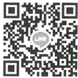
กลุ่มไลน์ (Line) “BAS(69)-Quota”

5. วันที่ 20 เมษายน พ.ศ. 2569 ทางคณะฯ จะดำเนินการสอบสัมภาษณ์ผ่านทางโปรแกรมประชุมออนไลน์ Google Meet โดยผู้สมัครไม่ต้องเดินทางมาสอบที่คณะฯ โดยให้ผู้ที่มีรายชื่อมีสิทธิสอบประเมินความสามารถด้วยการสอบสัมภาษณ์เข้ากลุ่มไลน์ (Line) “BAS(69)-Quota” เพื่อเป็นช่องทางในการนัดหมายการสอบสัมภาษณ์ ที่ลิงก์ https://line.me/R/ti/g/PvR-JeVJ5G หรือ สแกน QR code