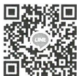
กลุ่มไลน์ (Line) “BAS(69)-Quota”

5. วันที่ 20 เมษายน พ.ศ. 2569 ทางคณะฯ จะดำเนินการสอบสัมภาษณ์ผ่านทางโปรแกรมประชุมออนไลน์ Google Meet โดยผู้สมัครไม่ต้องเดินทางมาสอบที่คณะฯ โดยให้ผู้ที่มีรายชื่อมีสิทธิ์สอบประเมินความสามารถด้วยการสอบสัมภาษณ์เข้ากลุ่มไลน์ (Line) “BAS(69)-Quota” เพื่อเป็นช่องทางในการนัดหมายการสอบสัมภาษณ์ ที่ลิงก์ https://line.me/R/ti/g/PvR-JeVJ5G หรือ สแกน QR code