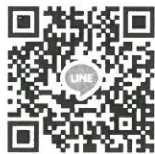
กลุ่มไลน์ (Line) “BAS(69)-Quota”

5. วันที่ 20 เมษายน พ.ศ. 2569 ทางคณะฯ จะดำเนินการสอบสัมภาษณ์ผ่านทางโปรแกรมประชุมออนไลน์ Google Meet โดยผู้สมัครไม่ต้องเดินทางมาสอบที่คณะฯ โดยให้ผู้ที่มีรายชื่อมีสิทธิ์สอบประเมินความสามารถด้วยการสอบสัมภาษณ์เข้ากลุ่มไลน์ (Line) “BAS(69)-Quota” เพื่อเป็นช่องทางในการนัดหมายการสอบสัมภาษณ์ ที่ลิงก์ https://line.me/R/ti/g/PvR-JeVJ5G หรือ สแกน QR code